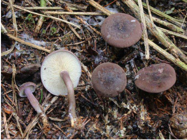
Abb. 5: Calocybe obscurissima - Düsterer Schönkopf (J.-A. Mentken).