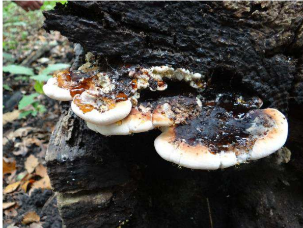
Abb. 1: Ischnoderma resinosum - Laubholz-Harzporling (T. Kalveram).