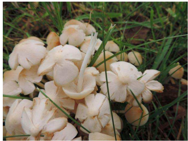
Abb. 4: Psathyrella multipedata - Büscheliger Faserling (R. Thebud-Lassak).