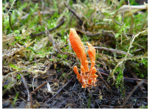
Abb. 6: Cordyceps militaris - Puppen-Kernkeule (T. Kalveram).