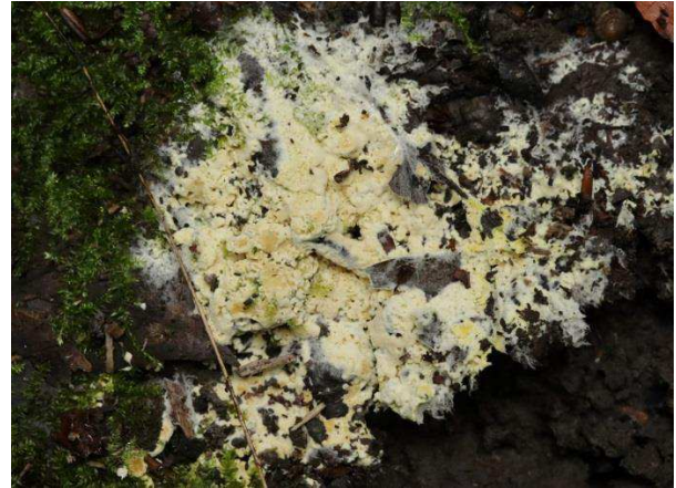
Abb. 2: Cristinia rhenana – Rheinischer Körnchenrindenpilz (B. Sothmann).