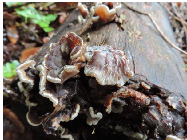
Abb. 2: Auricularia mesenterica - Gezonter Ohrlappenpilz (R. Thebud-Lassak).