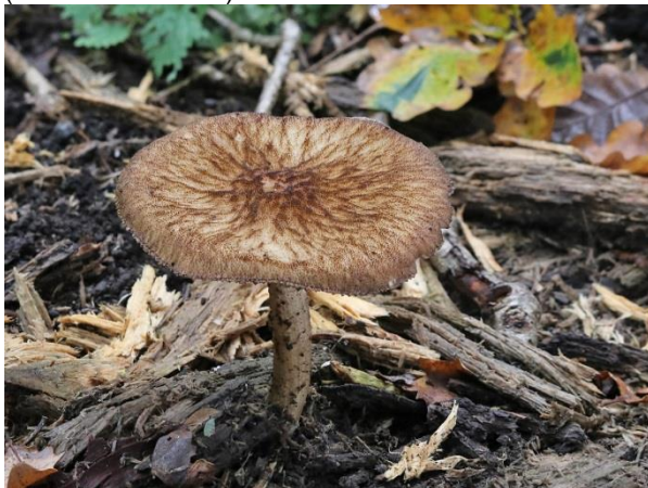
Abb. 3: Plutueus umbrosus – Schwarzsamtiger Dachpilz (J.-A. Mentken).