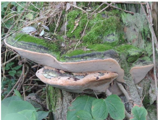
Abb. 1: Phellinus igniarius – Weidenfeuerschwamm (R. Thebud-Lassak).