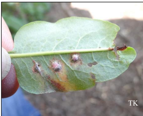
Abb. 1: Microbotryum pustulatum – Wiesenknöterich-Pustelbrand

Bemerkenswert war v. a. Lophiotrema borealiforme .