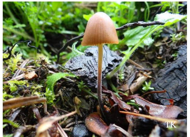
Abb. 4: Langstieliges Samthäubchen ( Conocybe subpubescens )