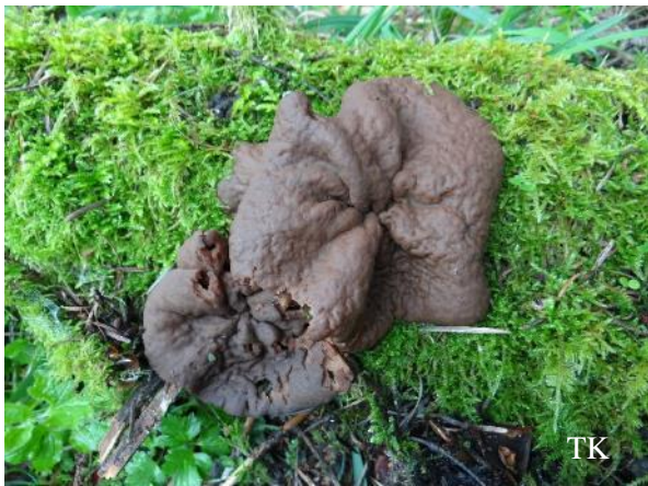
Abb. 3: Scheibenlorchel ( Gyromitra ancilis )