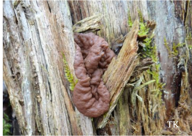
Abb. 2: Scheibenlorchel ( Gyromitra ancilis )