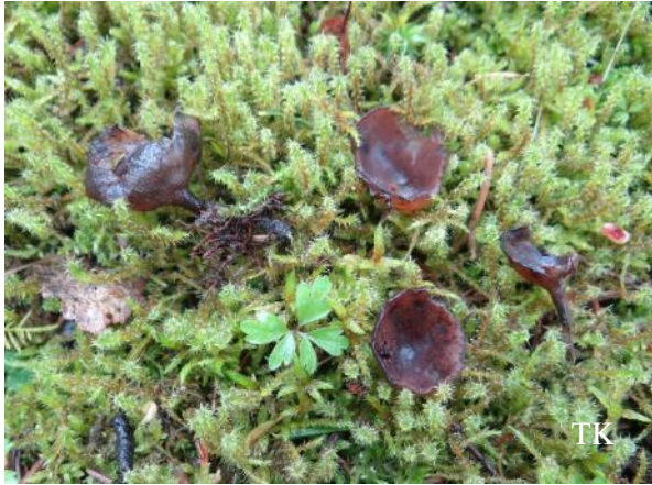
Abb. 1: Anemonenbecherling ( Dumontinia tuberosa )