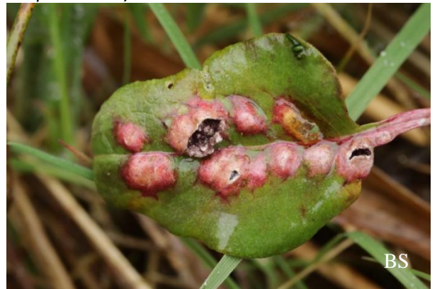
Abb. 6: Microbotryum pustulatum