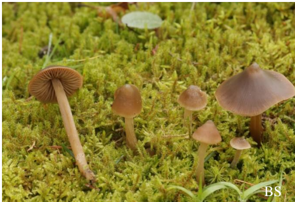
Abb. 5: Spitzkegeliger Glöckling ( Entoloma cuneatum )