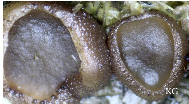
Abb. 8: Microbotryum pustulatum

Bemerkenswert: Capitotricha bicolor , Gyromitra ancilis , Morchella elata , Conocybe subpubescens , Hygroaster asterosporus und Vibrissea flavovirens .