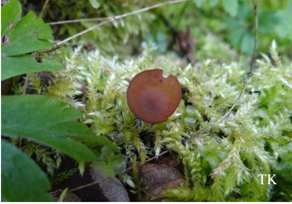
Abb. 1: Anemonenbecherling