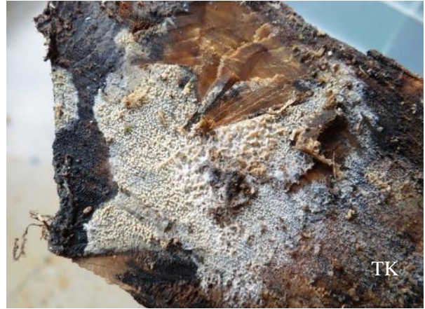
Abb. 4: Warziger Zähnchen-Rindenpilz ( Xylodon nesporei )