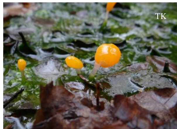
Abb. 2: Sumpfhaubenpilz ( Mitrella paludosa )