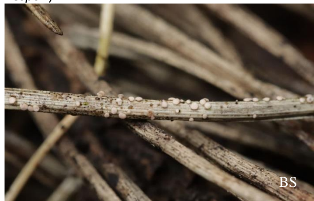
Abb. 6: Weißbraunes Kiefernadelbecherchen ( Pseudohelotium pinetii )