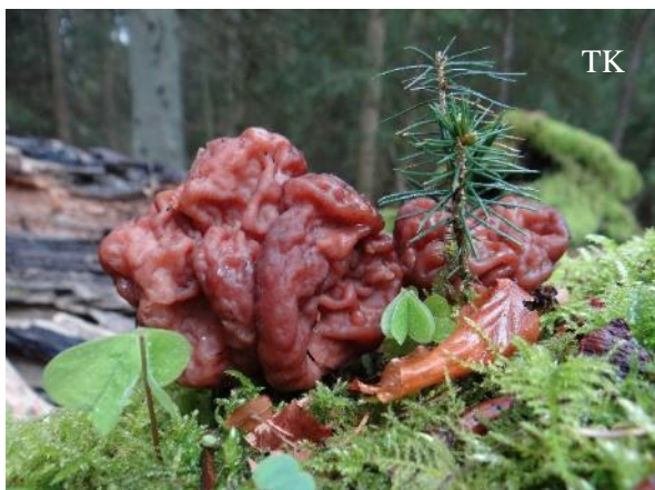
Abb. 1: Frühjahrslorchel ( Gyromitra esculenta )