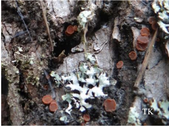
Abb. 3: Gelbes Harzbecherchen ( Sarea resiniae )