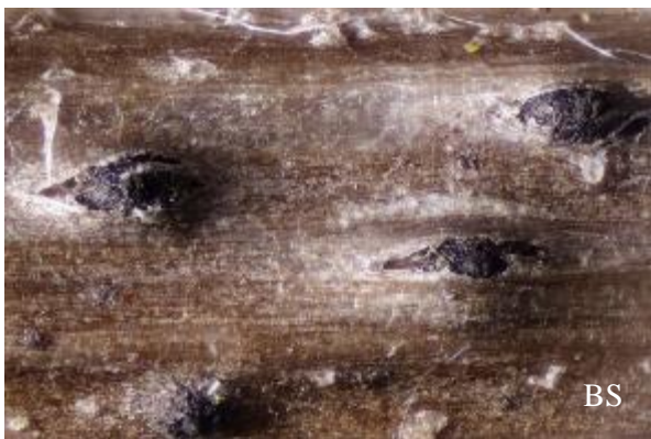
Abb. 5: Zugespitzter Schlangenwerferkugelpilz ( Ophiobolus acuminatus )