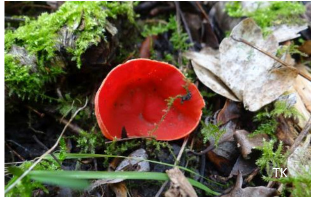
Abb. 8: Sarcoscypha coccinea - Scharlachroter Kelchbecherling