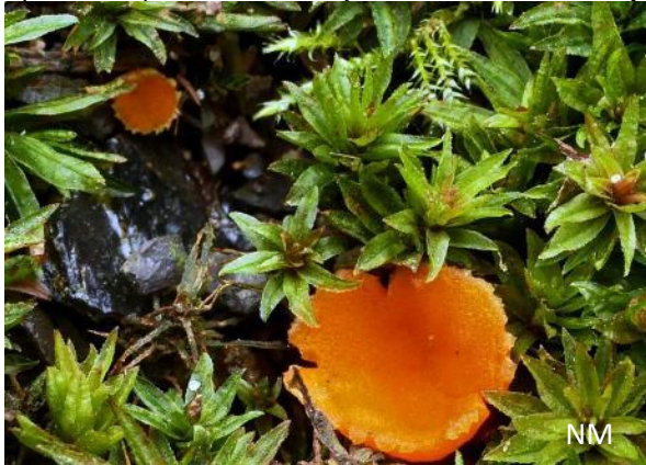
Abb. 1: Neottiella albocincta - Atrichum-Moosschälchen

Bemerkenswert waren u.a.: Berlesiella nigerrima - Miniaturbrombeeren-Kernpilz, Hysterium pulicare - Gewöhnlicher Spaltkohlenpilz und Resinomycena saccharifera - Ölzystiden-Helmling