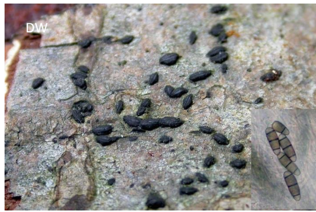
Abb. 6: Hysterium pulicare - Gewöhnlicher Spaltkohlenpilz