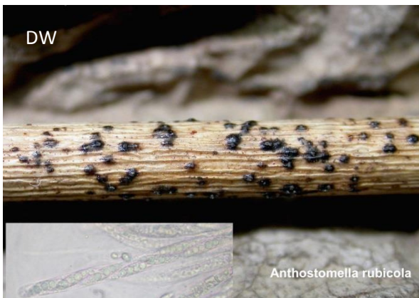
Abb. 5: Anthostomella rubicola