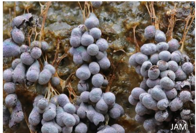
Abb. 4: Badhamia utricularis