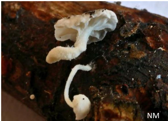
Abb. 3: Resinomycena saccharifera - Ölzystiden-Helmling