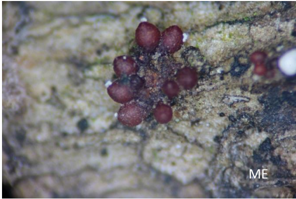
Abb. 7: Neonectria hederae