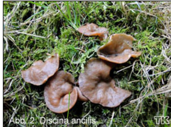
Abb. 2: Discina ancilis

lich“ an Fichte gebunden. Der gesuchte Pilz wuchs nämlich nicht in der Nadelstreu, sondern an morschem Fichtenholz. Die Rede ist vom Größten Scheibling ( Discina ancilis ), s. Abb. 2. Er bildet teller- bis