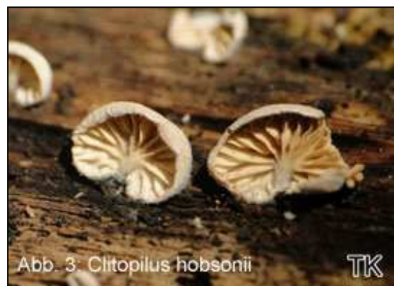
Abb. 3: Clitopilus hobsonii

scheibenförmige Fruchtkörper aus und gehört ähnlich wie die Morcheln aufgrund seiner Größe zu den auffälligen Frühlingsascomyceten. Verwechseln könnte man den Größten Scheibling mit dem Morchelbecherling ( Disciotis venosa ). Diese Art riecht jedoch deutlich nach Chlor, wächst nicht auf Holz und benötigt basenhaltigere Böden. Erst im Juli gelang der nächste interessante Fund. Im Katzenbusch in Herten, in dem übrigens einst Rudi Assauer das Fußballspielen lernte (und vielleicht sogar gegen Fredi Kasperek spielte), wurde der Blassblättrige Räsling ( Clitopilus hobsonii ) gefunden, s. Abb. 3. Auch