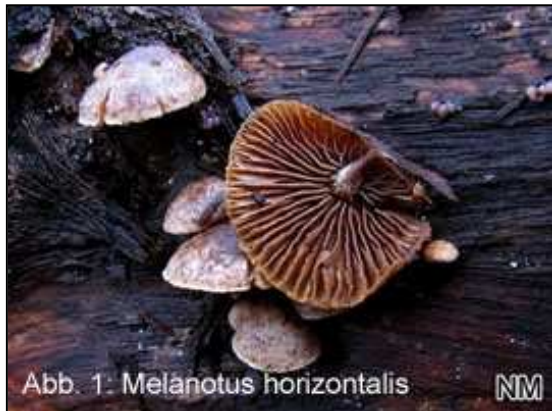
Abb. 1: Melanotus horizontalis

Nachdem die Januarexkursion ein Opfer von Schnee und Eis geworden war, ging es erst im Februar „in die Pilze“. Anfang des Monats wurde im Katzenbusch in Herten ein Pilz gefunden, der in den gängigen Bestimmungsbüchern nicht abgebildet ist. Es handelte sich um das Laubholzmuschelfüßchen ( Melanotus horizontalis ), s. Abb 1. Dieses kleine Pilzchen ähnelt einem