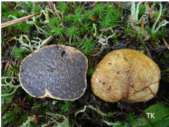
Abb. 5: Rhizopogon luteolus - Gelbliche Wurzeltrüffel