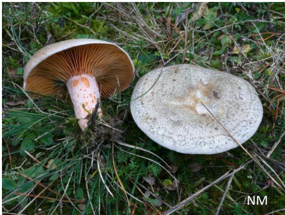
Abb. 9: Lactarius quieticolor - Brauner Kiefern-Blutreizker