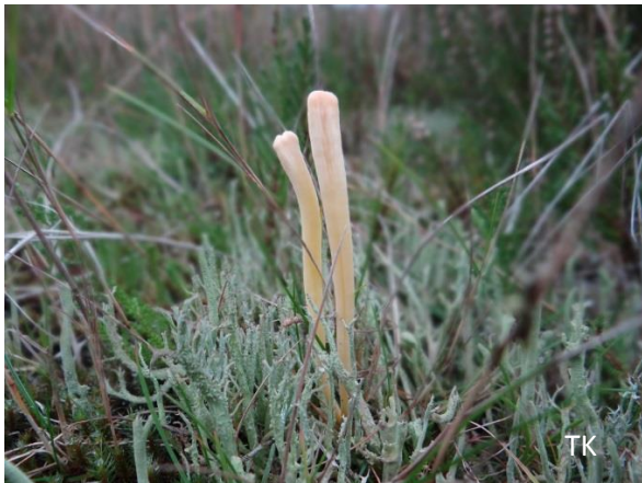
Abb. 3: Clavaria argillacea - Heidekeule