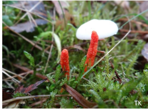
Abb. 2: Cordyceps militaris - Orangerote Puppenkernkeule