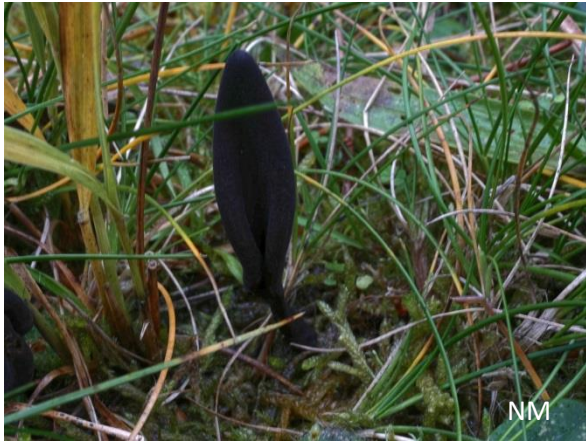
Abb. 7: Geoglossum elongatum - Kurzsporige Erdzunge