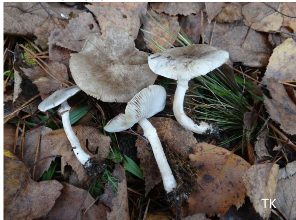
Abb. 4: Tricholoma cingulatum – Beringter Erdritterling