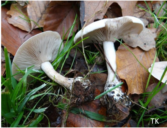
Abb. 1: Lepista irina - Veilchen-Rötleritterling