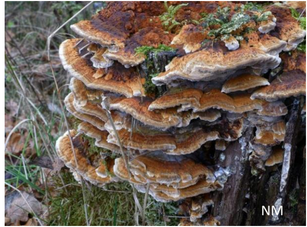
Abb. 8: Inonotus radiatus - Erlen-Schillerporling