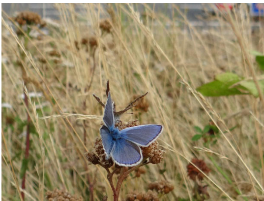
Abb. 5: Hauhechelbläuling

Die Wespenspinne ( Argiope bruennichi ) (= Zebraspinne) ist eine Spinne aus der Familie der Echten Radnetzspinnen. Die Männchen erreichen eine Körperlänge von sechs mm, während die Weibchen 25 mm groß werden, Abb. 6. Die Art hat in den letzten Jahrzehnten ihr Areal vom Mittelmeer deutlich nach Norden hin erweitert. Im Netz fällt meist ein zickzackförmiges Band unterhalb der Nabe auf.