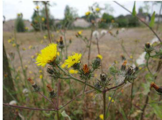
Abb. 8: Gewöhnliches Bitterkraut