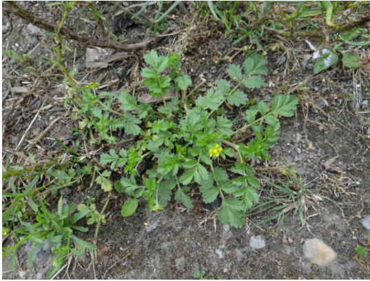
Abb. 3: Niedriges Fingerkraut