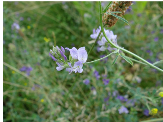
Abb. 2: Luzerne

Das Niedrige Fingerkraut ( Potentilla supina ) zählt zur Familie der Rosengewächse (Rosaceae). Die Laubblätter besitzen zwei bis sechs Paare Fiederblättchen, s. Abb. 3. Das Niedrige Fingerkraut kommt in der mitteleuropäischen Florenregion recht selten und oft unbeständig vor. Es ist auf den östlich an den Krupp-Park angrenzenden Brachflächen eingebürgert.