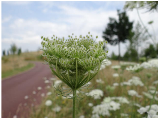
Abb. 7: Wilde Möhre

Widerhaken aufweisen. Es bevorzugt mäßig trockene bis frische, lehmig-steinige, meist basische bis kalkreiche, eher stickstoffreiche Böden, z.B. ruderal beeinflusste Halbtrockenrasen.