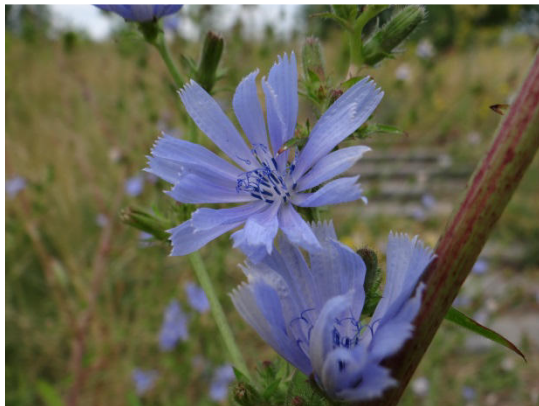
Abb. 1: Wegwarte

Die Bastardluzerne ( Medicago x varia ) ist eine Hybride zwischen der Luzerne ( Medicago sativa ) und dem Sichelklee ( Medicago falcata ). Die Farben der Blütenkronen reichen von dunkelviolett bis gelblich. Blaublütige Formen nähern sich dabei Medicago sativa an, gelbliche Blüten Medicago falcata . Die Bastard-Luzerne wird weltweit als Viehfutter angebaut. Die Gattung ist nach dem Land „Medien“ benannt (NW-Teil von Persien), aus dem die Luzerne stammt. Familie: Schmetterlingsblütler (Fabaceae), Abb. 2.