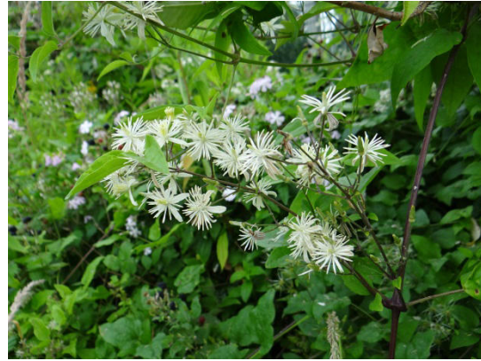
Abb. 4: Gewöhnliche Waldrebe

Der Hauhechelbläuling ( Polyommatus icarus ) ist unser häufigster Bläuling. Die Geschlechter dieser Schmetterlingsart sehen unterschiedlich aus (Geschlechtsdimorphismus). Bei den Weibchen ist die Flügeloberseite bräunlich-blau, bei den Männchen ist sie kräftig blau gefärbt, s. Abb. 5. Die Raupen fressen an einer Vielzahl verschiedener Schmetterlingsblütler, z.B. an Hauhechel und Luzerne, v.a. aber an Hornklee. Die Falter fliegen in mehreren Generationen von Mai bis September.